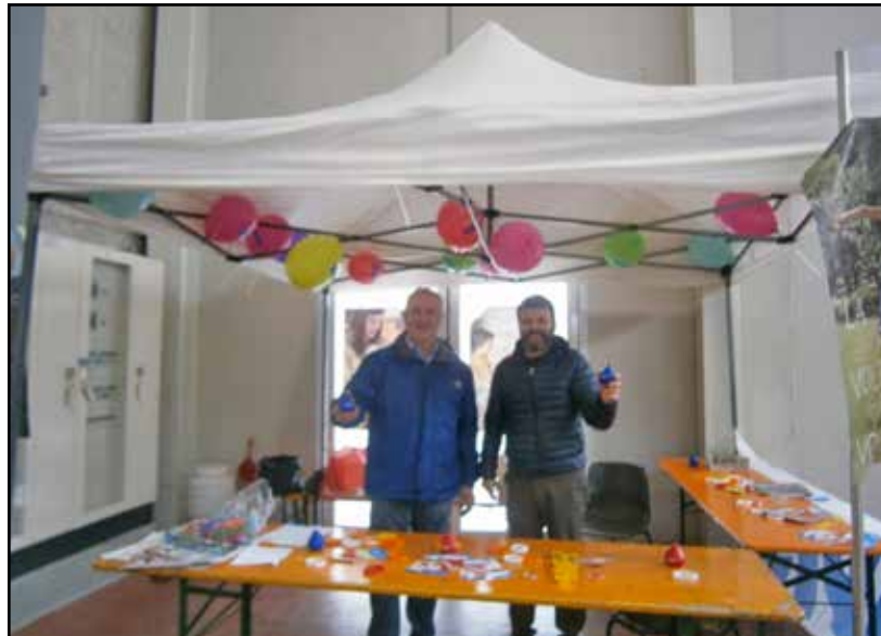
Il Presidente Paolo Bettensoli allo stand dell'Avis.

Abbiamo raccolto i nominativi di nuovi potenziali donatori, traguardo a cui auspichiamo in queste occasioni di promozione, ma è comunque sempre utile parlare dell'importanza del donare sangue, seminare buoni propositi nel cuore di giovani e di bambini, che se informati nel modo a loro più adeguato, ne faranno tesoro e saranno il futuro dell'Avis.