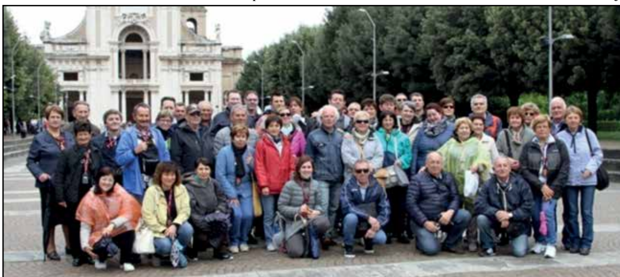
I partecipanti alla gita.